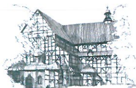
Kościół Pokoju pw. Św. Trojcy Wpisany na listę UNESCO